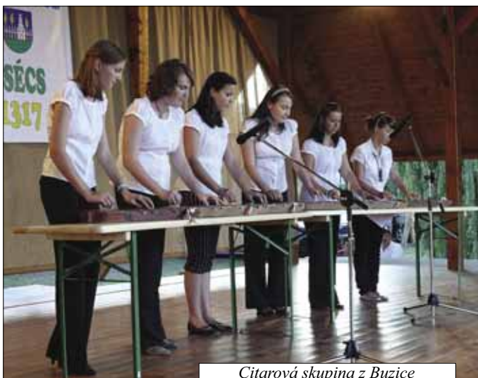
Citarová skupina z Buzice