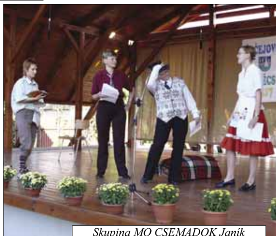
Skupina MO CSEMADOK Janík