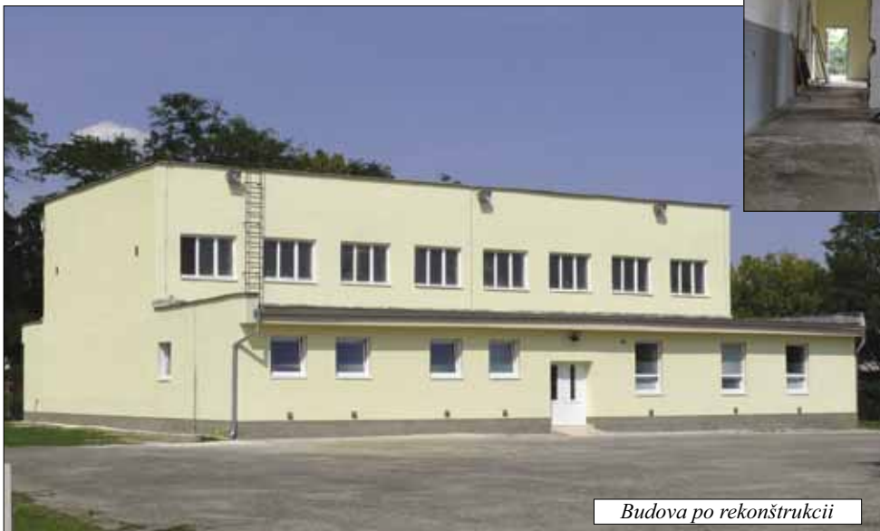
Budova po rekonštrukcii

Čečejevského kultúrneho leta 2008 a augustových oslavách Dní obce Čečejevce. Na rekonštrukciu budovy bola použitá časť prostriedkov z predaja časti areálu bývalej materskej školy.