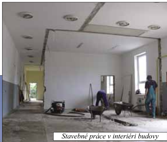
Stavebné práce v interiéri budovy

Na základe rozhodnutia Obecného zastupiteľstva v Čečejevciach sa v letných mesiacoch previedla rekonštrukcia budovy a zariadenia sociálnych priestorov areálu telocvične na Kostolnej ulici. Vynovené priestory prednej časti budovy, kde vznikli nové sociálne zariadenia, šatne a spoločenská miestnosť, už boli využité pri kultúrnych podujatiach v rámci