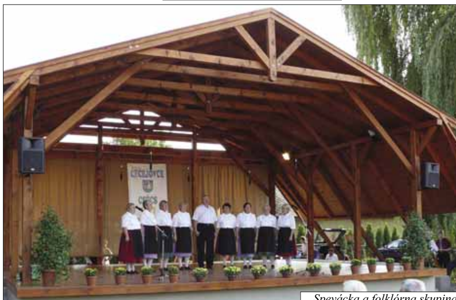
Spevácka a folklórna skupina MO CSEMADOK Čečejevce