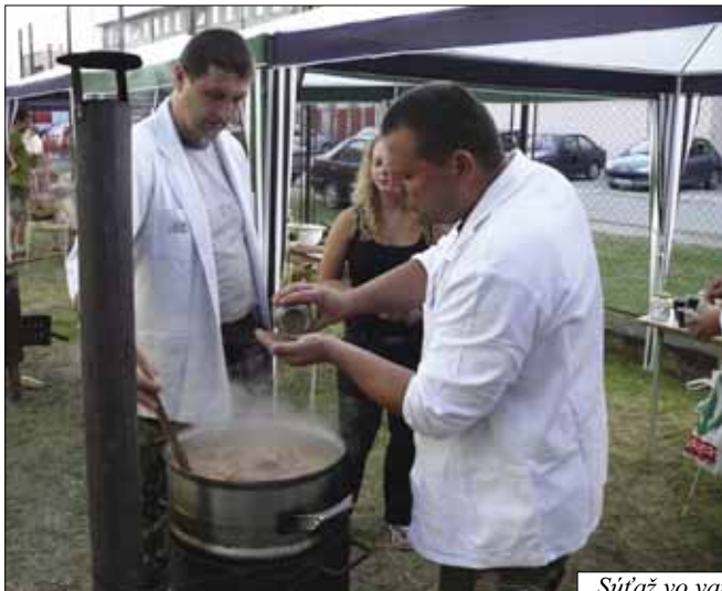
Súťaž vo varení poľovnickeho guláša