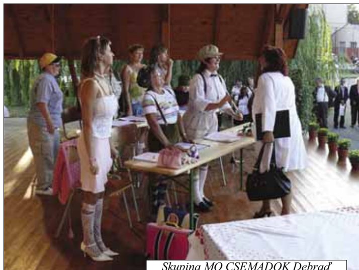
Skupina MO CSEMADOK Debraď