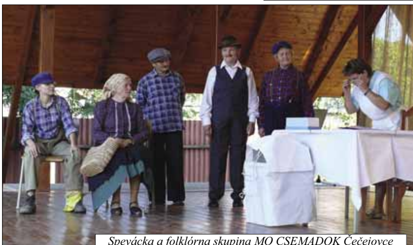
Spevácka a folklórna skupina MO CSEMADOK Čečejojce