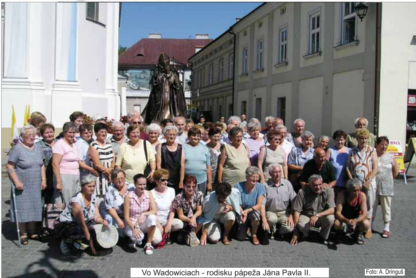
Vo Wadowiciach - rodisku pápeža Jána Pavla II.