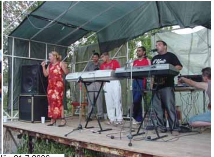
Rómsky festival dňa 21.7.2006