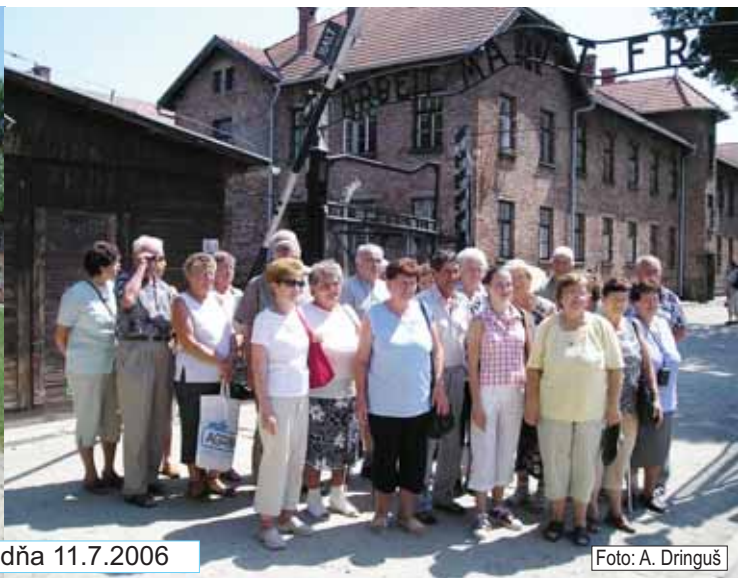
Výlet do Oswiečima dňa 11.7.2006