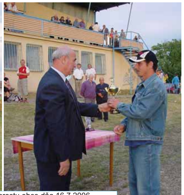
Futbalový turnaj o pohár starostu obce dňa 16.7.2006