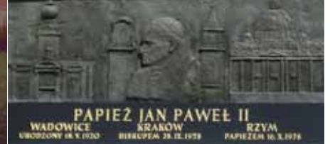
PAPIEŻ JAN PAWEŁ II WADOWICE ŚRABOW RZYMA URODZONY 18. V. 1920 BISKUPIAŃ 28. IX. 1978 PAPIEŻEM 16. X. 1978