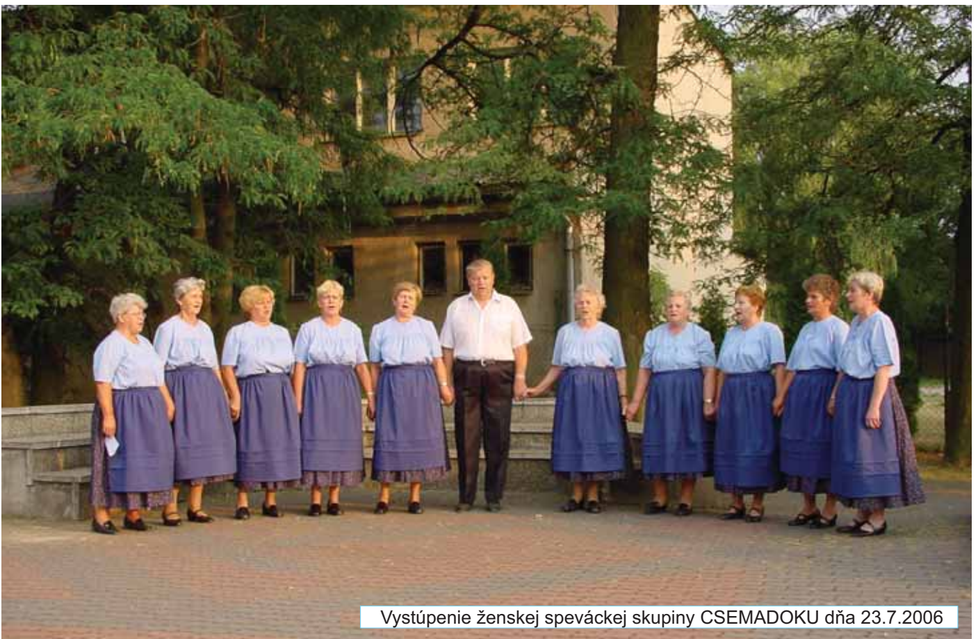
Vystúpenie ženskej speváckej skupiny CSEMADOKU dňa 23.7.2006