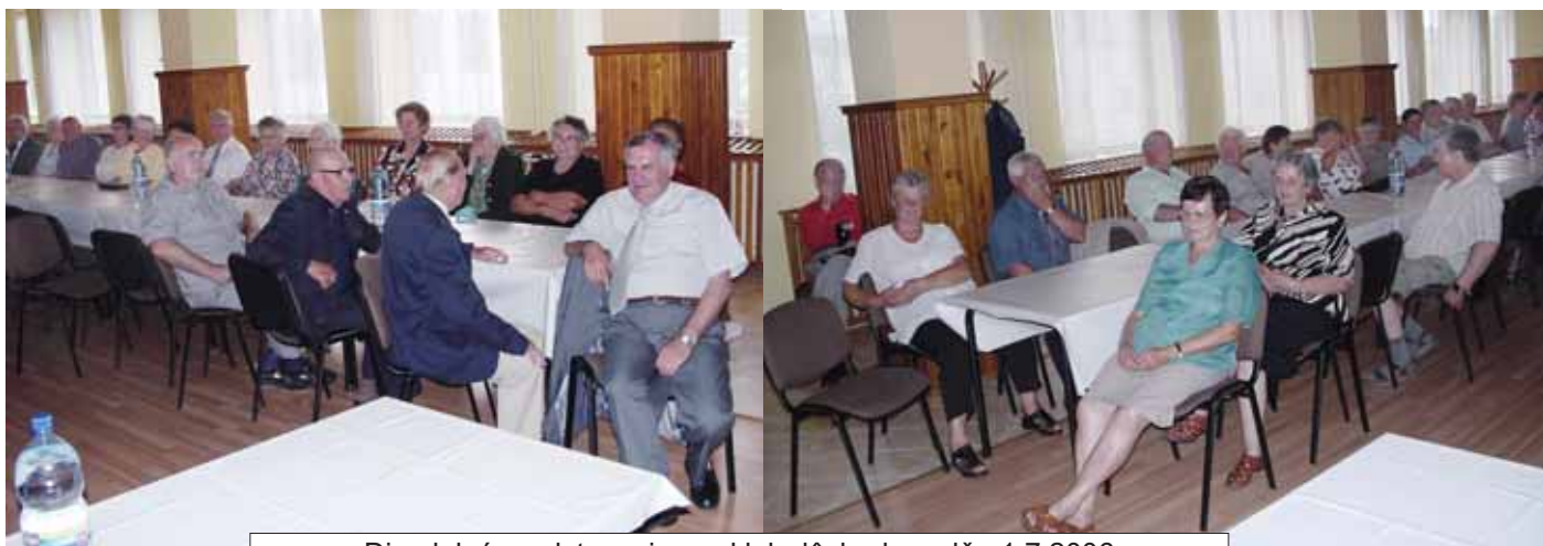
Divadelné predstavenie pre klub dôchodcov dňa 1.7.2006

Záverom Čečejovskeho kultúrneho leta bude Deň obce Čečejoyce , ktorý sa uskutoční 27.8.2006 v športovom areáli. Program a pozvánku na toto podujatie uvádzame na poslednej strane týchto novín. (R)