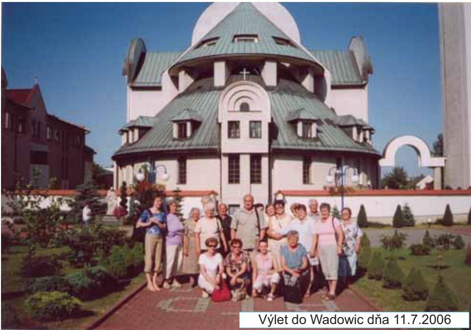
Výlet do Wadowic dňa 11.7.2006