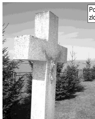
Pohľad na jeden z krížov, z ktorého zloděj ukradol korpus

Začiatkom marca mnohí z nás boli šokovaní z toho, čo sa stalo na miestnom cintoríne. Niečo podobné totiž nemá obdobu v našej obci. Na takmer 50 krížoch pomníkov boli poškodené alebo z nich úplne zmizli korpusy, väčšinou kovové, ale výnimkou neboli ani polámané porcelánové korpusy. Podľa všetkého zloději našich čias už nemajú ohľad ani na posvätnosť miesta večného odpočinku mŕtvych a pre vidinu niekoľkých korún za odovzdaný kovový odpad spôsobia škodu za niekoľko desiatok tisíc korún. Údajným páchatelom bola maloletá osoba. Otázne však je, s vedomím koho sa tento odsúdeniahodného činu táto osoba dopustila a prečo tomu nezabránili rodičia páchatel'a. (R)