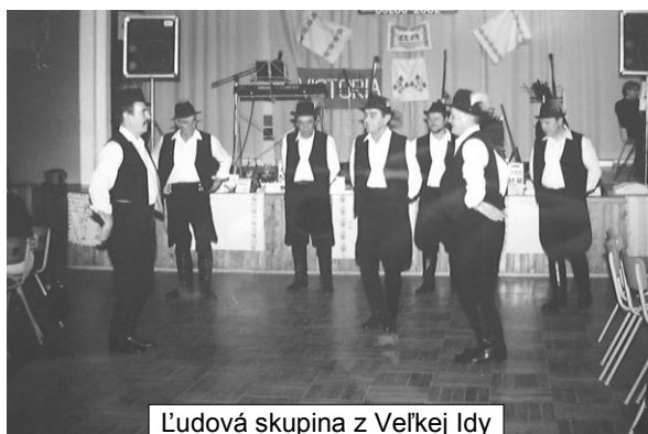
Ľudová skupina z Veľkej Idy