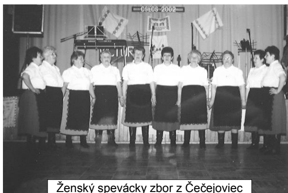
Ženský spevácky zbor z Čečejeviev

predseda základnej organizácie Csemadoku