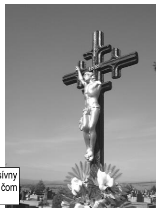
Pozornosti zlodēja neušiel ani masívny liatinový centrálny kríž na cintoríne, o čom svedčí odlomená ruka korpusa