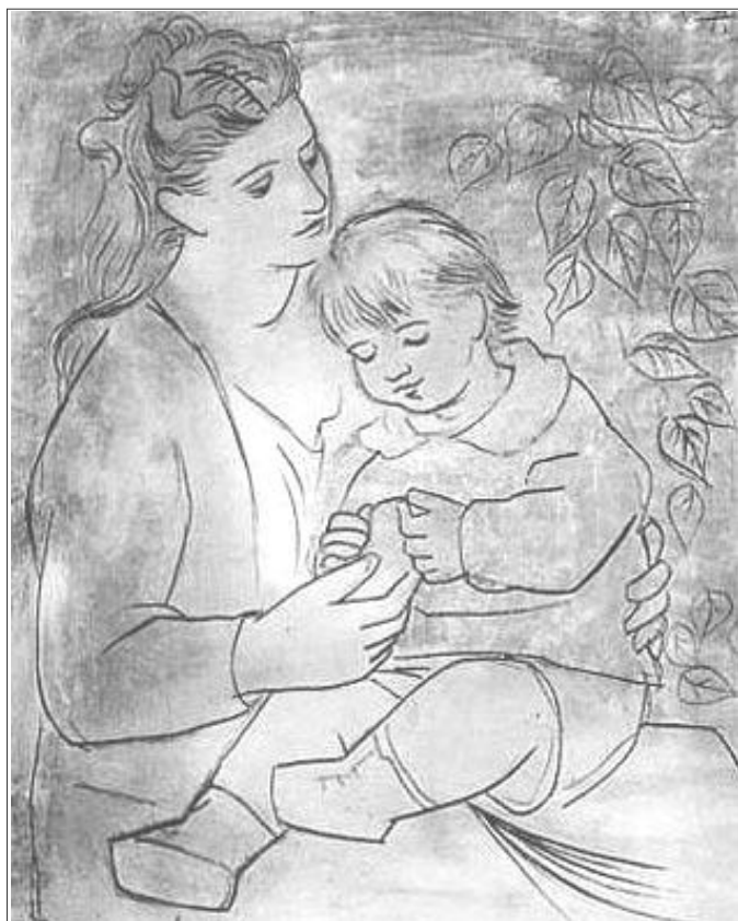
Pablo Picasso: „Matka a dieťa“