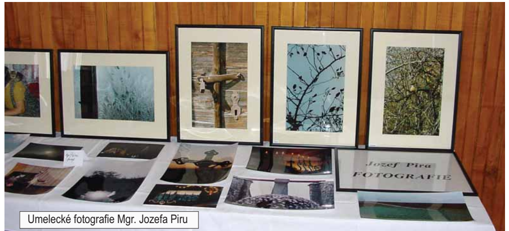
Umelecké fotografie Mgr. Jozefa Pira