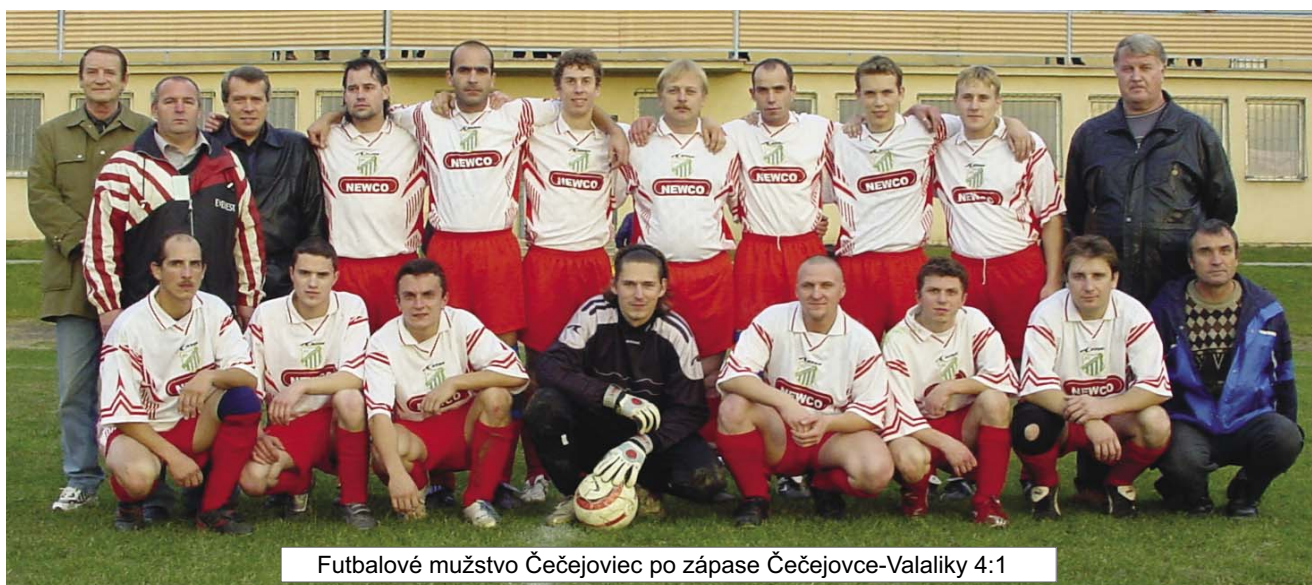
Futbalové mužstvo Čečejevciac po zápase Čečejevce-Valalíky 4:1