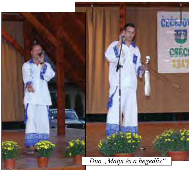
Duo „Matyi és a hegedűs“