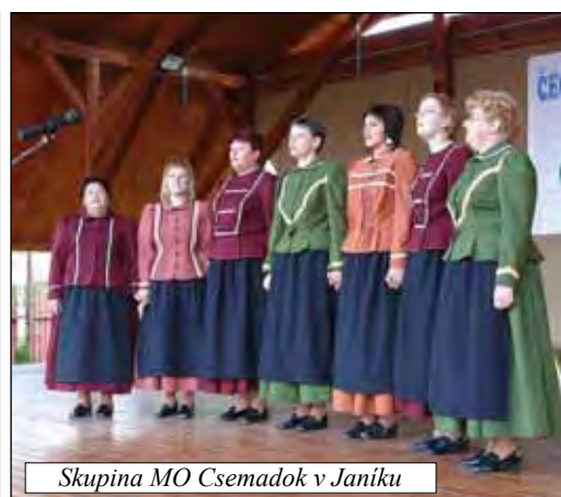
Skupina MO Csemadok v Janiku