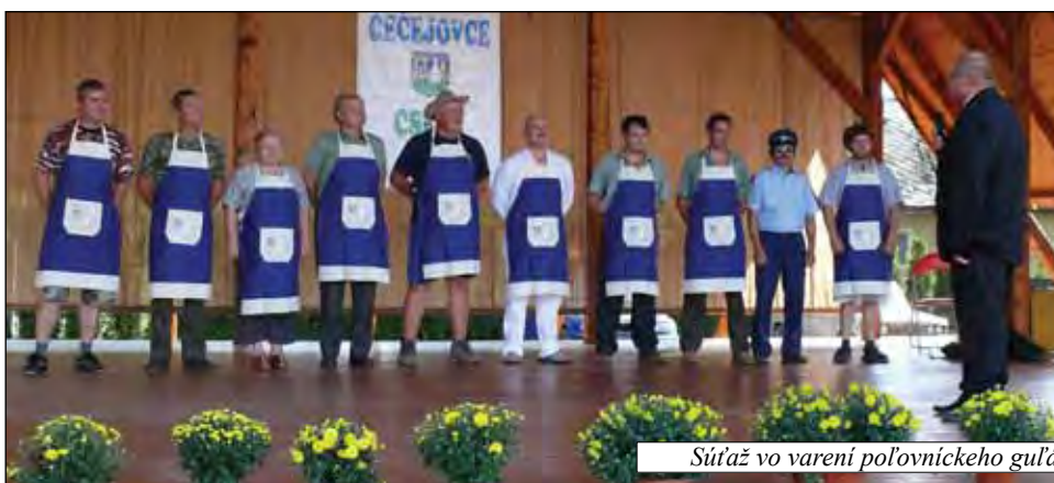
Súťaž vo varení poľovníckeho guľáša