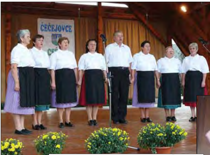
Spevácka a folklórna skupina MO CSEMADOK Čečejoyce