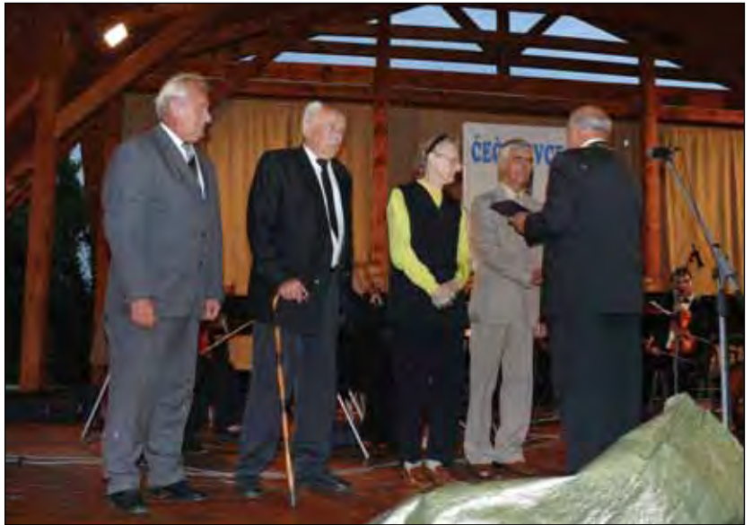
Odovzdanie pamätných plaket obce

Vo večerných hodinách sa najprv predstavilo hudobné duo „Matyi és a hegedűs“ z Maďarska a vyvrcholením druhého dňa osláv pred úplne zaplneným hľadiskom bolo vystúpenie hudobnej skupiny SENZUS. (R)