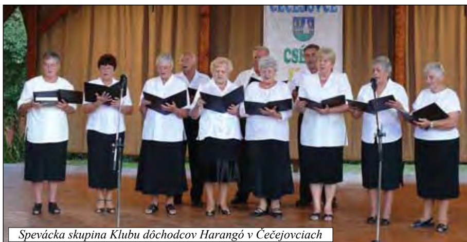
Spevácka skupina Klubu dôchodcov Harangó v Čečejovciah