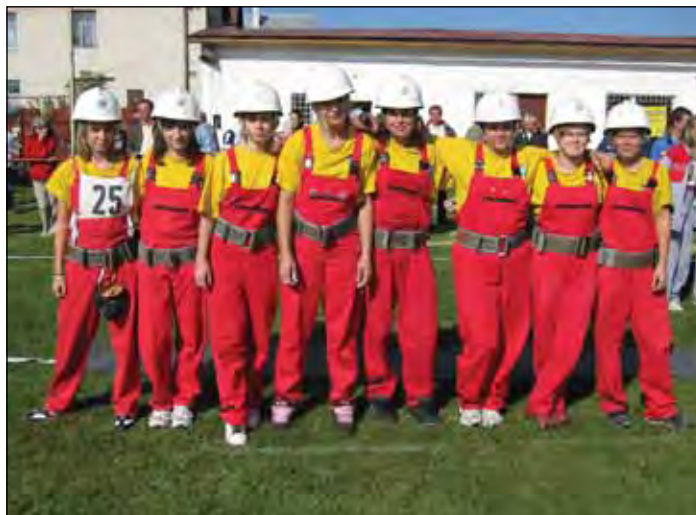
Družstvo pred štartom na súťaži Východoslovenskej hasičskej ligy v Šuňave