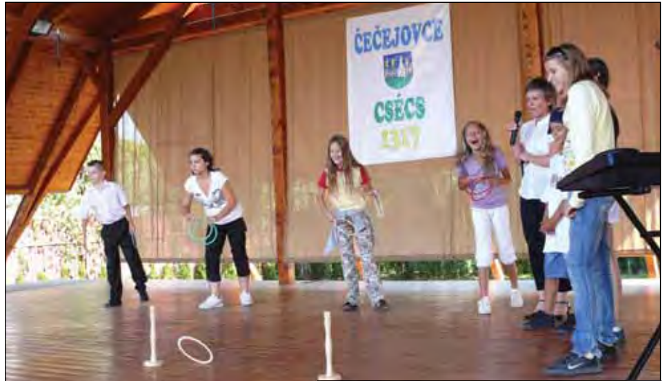
Žiaci ZŠ s MŠ Čečejoyce