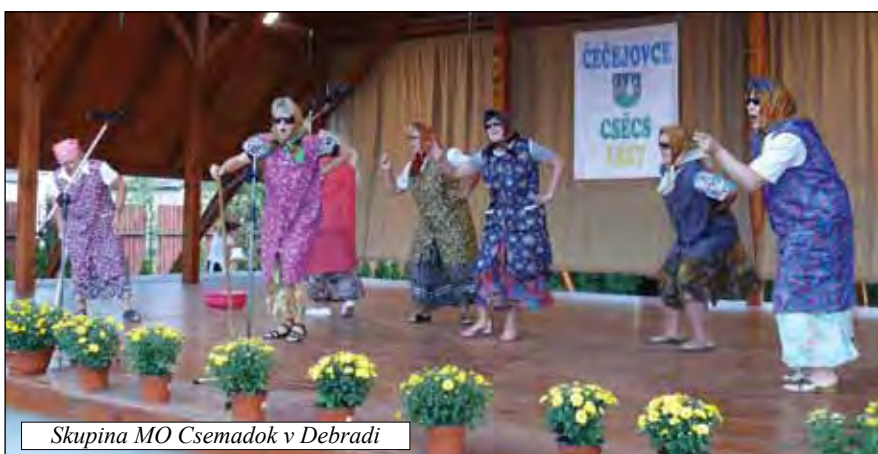
Skupina MO Csemadok v Debradi