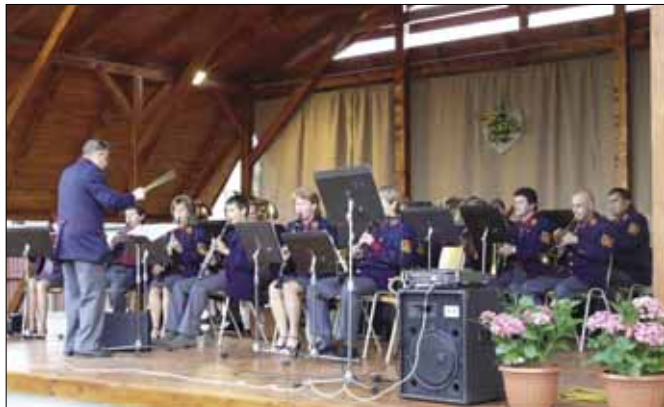
Koncert dychovej hudby zo Štósu dňa 6. augusta 2007 na prírodnom javisku