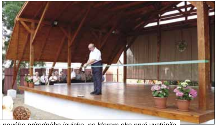
Slávnostné otvorenie nového prírodného javiska, na ktorom ako prvá vystúpila Spevácka a folklórna skupina MO Csemadoku dňa 22. júla 2007